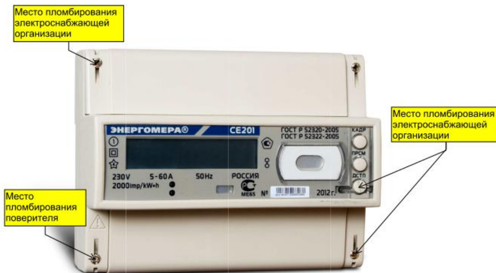
Рисунок 2 – Общий вид счетчика CE 201 R8