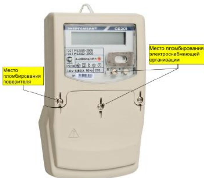
Рисунок 3 – Общий вид счетчика CE 201 S7